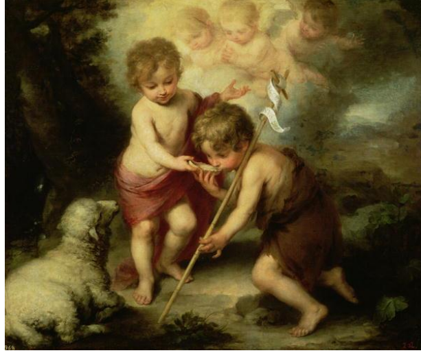
குழந்தைகளாக இயேசுவும் (இடது), யோவானும். --- ஓவியர் முரில்லோ

திருமுழுக்கு யோவானைப் பற்றி அவரது தந்தை செக்கரியா, "குழந்தாய், நீ உன்னத கடவுளின் இறைவாக்கினர் எனப்படுவாய்; ஏனெனில் பாவ மன்னிப்பால் வரும் மீட்பை அவர்தம் மக்களுக்கு அறிவித்து ஆண்டவருக்கான வழியைச் செம்மைப்படுத்த அவர் முன்னே செல்வாய்" என்று இறைவாக்கு உரைத்தார்.